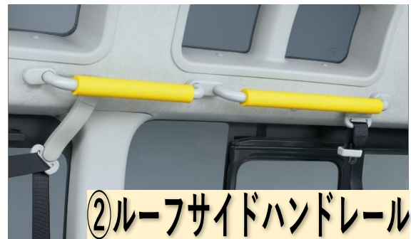
②ルーフサイドハンドレール