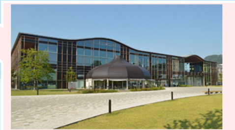
岐阜県岐阜市司町40番地5