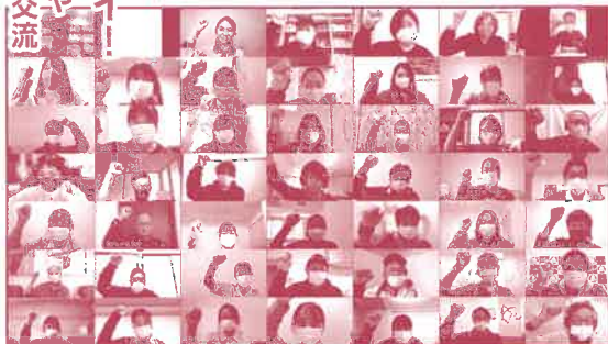
(令和4年度 オンライン開催時の様子)