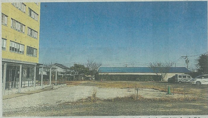
日本初のペット同伴病棟を開設する海津市医師会病院。病棟横にドッグラン建設を予定している＝昨年12月、同市海津町福江

病棟は、現在使用していない海津市医師会病院の3階に開設し、来年夏までに40床まで増やす計画。個室にベッドと犬用ケージを置き、屋外にはドッグランを開設する。犬は予防接種を受け、健康に問題のないことなどが条件。犬の出入りは非常口を使って患者と導線を分け、衛生面に配慮する。