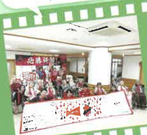
特別養護老人ホーム 桜の園(富岡町)